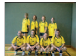
Dritter Platz, und knapp am Gewinn des Wanderpokals vorbeit: „Hartbergvolley“

Nach einer Vorrunde, bei der in drei Gruppen jeder gegen jeden spielte, und einer anschließenden kräftigen Jause ging es in der Hauptrunde um die Platzierungen. Fairness und Kampfgeist zeichneten die Spieler aus und so konnten nach vier Stunden die Meister im Festsaal gekürt werden. Wie schon in den vergangenen Jahren gab es neben Urkunden und Pokalen wieder herrliche Sachpreise für die eifrigen Kämpfer. Freude am Sport, Einsatzbereitschaft, aber auch Geselligkeit zeichnen diesen Nachmittag aus.